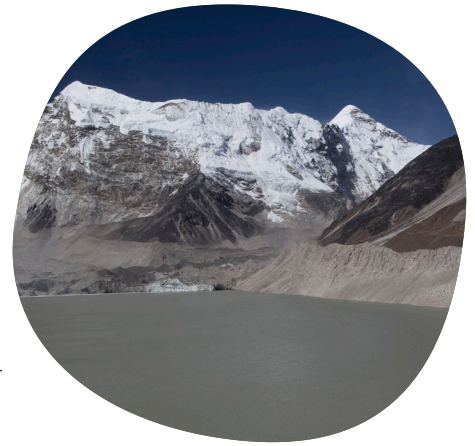
Deze gletsjer in Nepal is al aan het smelten.

Wat denk je dat erger is: dat de zeespiegel stijgt of dat het steeds warmer wordt? Waarom? Schrijf het op.